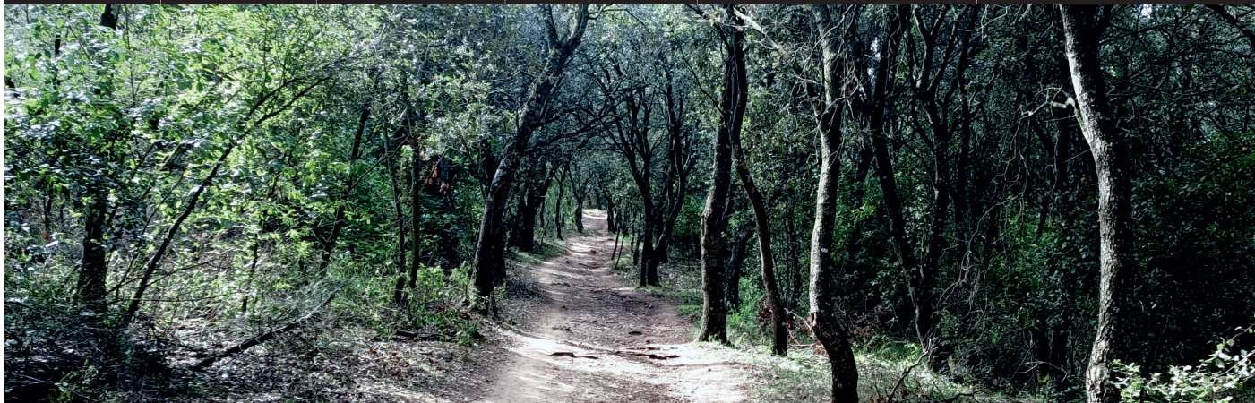
Descripción de la ruta / Ibilbidearen deskribapena