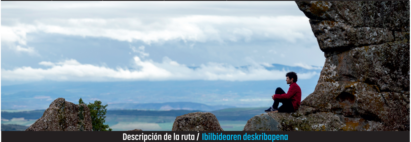
Descripción de la ruta / Ibilbidearen deskribapena